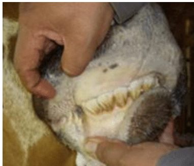
Figure 1. Changements compatibles avec l'anémie dans la coloration des muqueuses de la gueule, de l'œil et de la vulve (plus pâles ou jaunâtres)

Un cas d'anaplasmose bovine à Anaplasma marginale a été confirmé en octobre dans un élevage vache-veau de la MRC Brome-Missisquoi en Estrie. Au total, sept vaches du même pâturage ont présenté un dépérissement rapide associé à des signes d'anémie (figure 1) et parfois d'ictère (coloration jaunâtre), et six sont décédées. L'enquête épidémiologique n'a pas permis d'identifier la source d'introduction de la maladie. Aucun animal de l'élevage ne provenait des États-Unis mais plusieurs animaux ont été achetés de l'encan dans les dernières années. D'après les résultats, il est probable que la maladie ait été introduite dans le troupeau il y a un certain temps, à la suite de l'achat d'un animal infecté, et qu'elle s'y soit propagée. Des mesures de contrôle des animaux positifs sont volontairement appliquées par le producteur : les adultes sont gardés dans l'élevage ou envoyés directement à l'abattoir et les veaux seront envoyés directement en engraissement. La gestion de la maladie nécessite également le contrôle des tiques au pâturage, des insectes piqueurs et de l'équipement potentiellement contaminé par le sang (p. ex. aiguilles, écorneurs, couteaux de parage). Aucun traitement antibiotique n'est reconnu efficace pour éliminer la bactérie et les animaux restent généralement porteurs à vie.