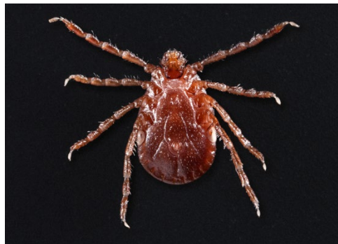
Figure 2. Vue ventrale d'une tique asiatique à longues cornes femelle ( Haemaphysalis longicornis )

À retenir : La theilériose et la tique asiatique à longues cornes menacent la santé des bovins canadiens, voyez comment protégez votre troupeau avec la fiche produite par le Système canadien de surveillance de la santé animale .