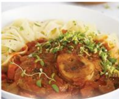
OSSO BUCO DE VEAU DE LAIT DU QUÉBEC À LA MILANAISE - ICI