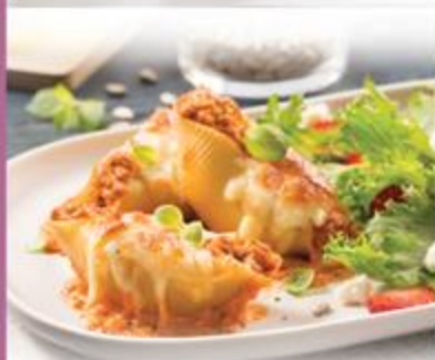
COQUILLES AU VEAU DE LAIT DU QUÉBEC HACHÉ, SAUCE ROSÉE - ICI