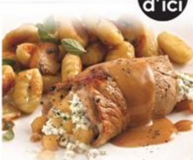
ESCALOPES DE VEAU DE LAIT DU QUÉBEC FARCIES AU FROMAGE DE CHÈVRE ET POIRES À L'ÉRABLE - ICI