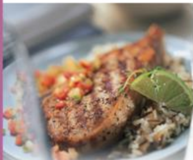
CÔTELETTES DE VEAU DE LAIT DU QUÉBEC PAYSANNES - ICI